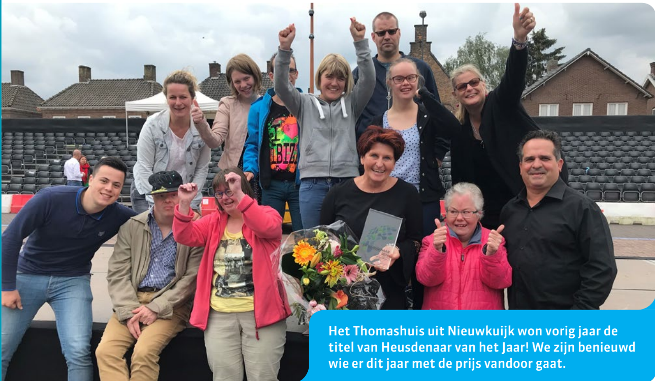
Het Thomashuis uit Nieuwkuijk won vorig jaar de titel van Heusdenaar van het Jaar! We zijn benieuwd wie er dit jaar met de prijs vandoor gaat.

De Dromen. Doen. Heusden. -awards worden dit jaar weer uitgereikt! Je kunt van 6 maart tot 25 maart 2019 je stem uitbrengen op de genomineerden! Wie verdient er volgens jou een award?